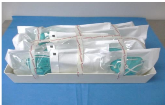
図 1：ロード用の N95 マスクの包装とトレイへの積載例