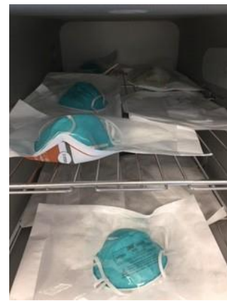
図 2：ロード用の N95 マスクの包装と棚への積載例