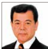
南城市市長 古謝 景春