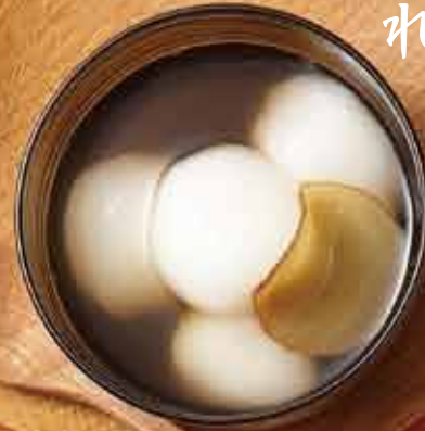
デザート 白玉だんごの ジンジャースープ