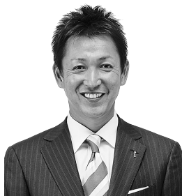
8020県民健口大使 立浪和義氏

8020運動発祥もとの愛知県歯科医師会では、平成22年度より立浪和義さんを“8020県民健口大使”に迎え、歯と口の健康維持管理の大切さを県民の皆様に啓発していきます。