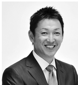
8020県民健口大使 立浪和義氏

愛知県歯科医師会では、本年度も立浪和義さんを「8020県民健口大使」に迎え、歯と口の健康維持管理の大切さを、県民の皆様に広く紹介していきます。