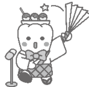
日本歯科医師会 PR キャラクター 「よ坊さん」