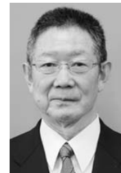
山口県歯科医師会会長

山口県歯科医師会では、県民の皆様の8020健康長寿社会を目指し、それを支える歯科医療を基盤として事業を展開しています。