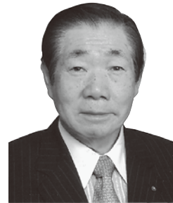
栃木県歯科医師会会長

栃木県歯科医師会は、県民の皆様が食べる器官である口や口腔（こうくう）の機能を生涯にわたり維持し、生涯健康であることを願っています。