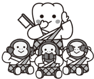
日本歯科医師会 PRキャラクター 栃木県ご当地「よ坊さん」

歯や口腔（こうくう）の機能を生涯にわたり維持することは、美味しく食べる、楽しく会話する、豊かな表情を整えるなど、私たちが日常生きていくために欠かせない身近な行動と密接な関係があります。