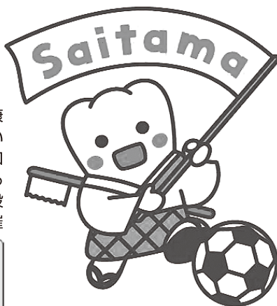
日本歯科医師会PRキャラクター よ坊さん（埼玉県）