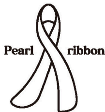
一輝く白い歯と笑顔のために

宮崎県歯科医師会が推進する パールリボン運動は8020 運動との相乗効果を期待して 「お口の健康を維持増進する ことは、健康寿命を延伸させ る」ということを県民の 皆様に広く知っていただく ための運動です。