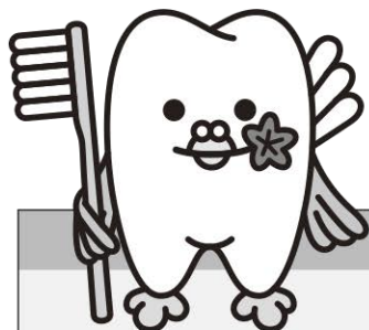
広島県歯科医師会イメージキャラクター 「はっぼくん」