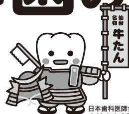
日本歯科医師会 PRキャラクター よ坊さん(宮城県)

「オーラルフレイル」とは、かんだり、飲み込んだりといった口の中の動きが衰えることを言います。特にむし歯や歯周病で歯を失うことから口の中の動きが衰え、それが全身的な身体の衰えにも繋がっていきとされています。また、糖尿病や心臓疾患等の全身疾患と歯周病との関わりも指摘されています。宮城県歯科医師会では、定期的な歯科医院受診や訪問歯科診療を進めることにより、健康長寿の実現を目指しています。