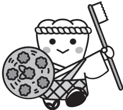
日本歯科医師会PRキャラクター よ坊さん(山形県)