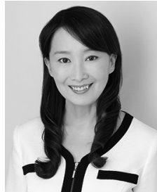
▲アグネス・チャン氏