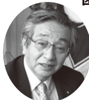
公益社団法人 岐阜県歯科医師会 会長