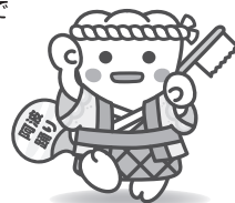
日本歯科医師会PRキャラクター よ坊さん(徳島県)