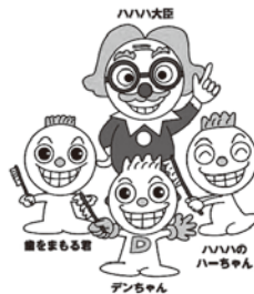
高知県歯の健康キャラクター ©やなせたかし/やなせスタジオ

私たち歯科医師会は、このような事業を通じて、県民の皆さまが、一生健やかに暮らせるよう、生涯を通じた歯と口の健康（健口）づくりのお手伝いをしてまいりますと考えております。