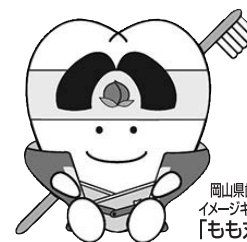
岡山県歯科医師会 イメージキャラクター 「もも丸くん」