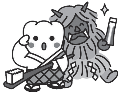
日本歯科医師会PRキャラクター よ坊さん(秋田県)