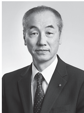
山形県歯科医師会会長