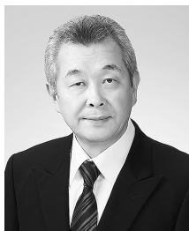
(一社)宮城県歯科医師会